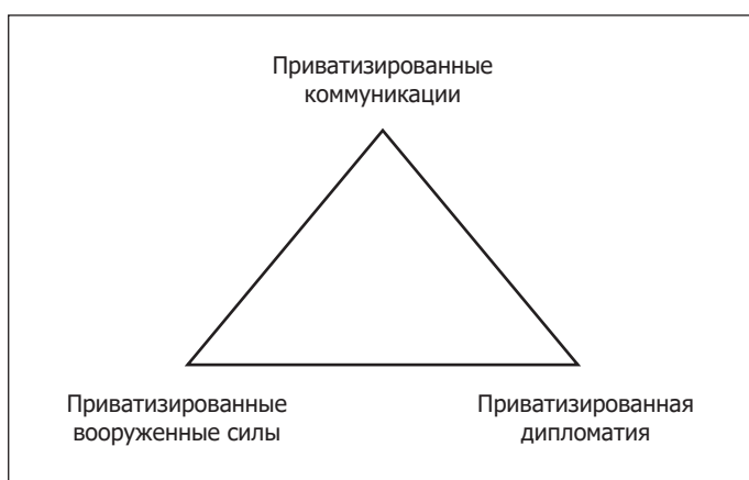
Рис. 2. Приватизация войны